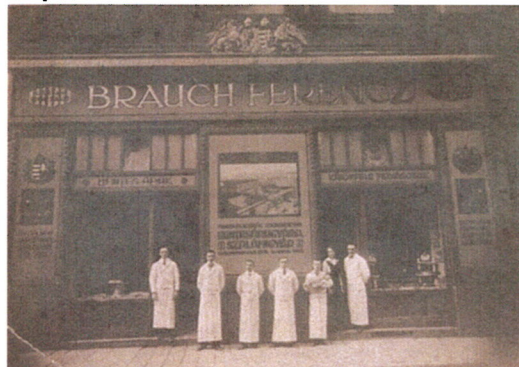
Brauch-mintabolt a Fővám tér 2. szám alatt, az egykori Nádor Szálló földszintjén