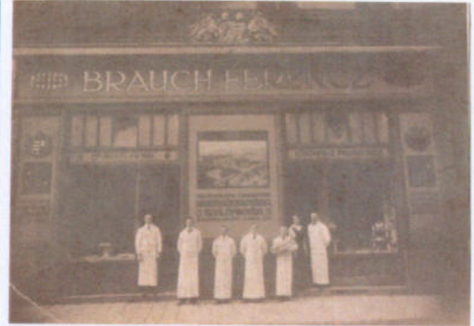
Brauch-mintabolt a Fővám tér 2. szám alatt, az egykori Nádor Szálló földszintjén